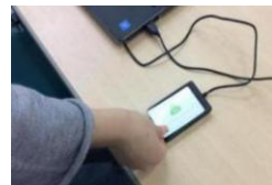
保護者様へ入室メール

千葉市が整備した Wi-Fi 設備を利用して、学校から出されるギガタブの宿題や課題をすることが可能となりました。